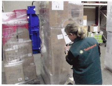
Afb. 1.49 In het magazijn moet voldoende ruimte zijn om bestellingen te ontvangen.