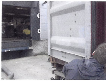
Afb. 1.48 Het magazijn zit vaak aan de achterkant van de winkel. Hier kunnen vervoerders de bestellingen afleveren.