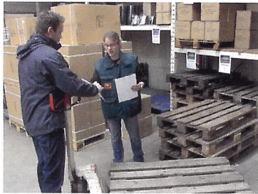
Afb. 1.55 Pallets gaan retour naar de leverancier. Ze zijn geld waard.

De producten die beschadigd zijn of van slechte kwaliteit zijn, worden teruggestuurd naar de leverancier. Je noemt dit retourneren. Ook statiegeldverpakkingen moeten weer terug naar de leverancier. Voorbeelden van statiegeldverpakkingen zijn: pallets , kisten, fusten en rolcontainers. Wat je terugstuurt schrijf je nauwkeurig op de pakbon. De leverancier stuurt na ontvangst van de retourzending of de statiegeldverpakkingen een creditnota . Dit is een omgekeerde factuur waarop staat hoeveel geld je terugkrijgt van de leverancier.