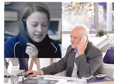
Afb. 1.57 De administratie regelt de retourzending.