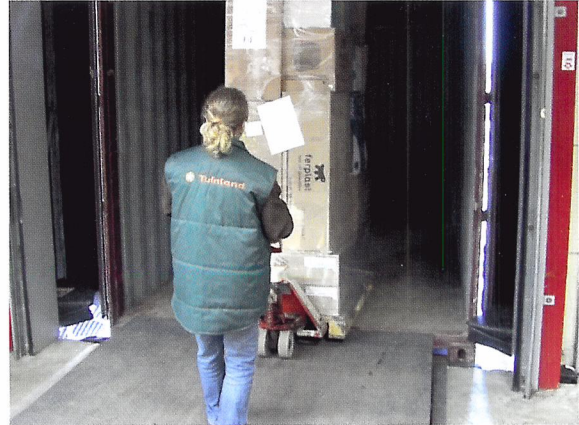
Afb. 1.47 Een koerier of groothandel levert de bestelling af. Daarna begint de verwerking.

Als een bestelling binnenkomt, wil je weten of het de juiste producten zijn. Je leert waar je op moet letten als je producten ontvangt en verwerkt.