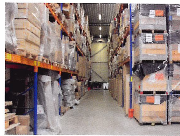
Afb. 1.50 Kleine producten worden vaak verpakt met elkaar tot een grootverpakking.

1.18 Waar worden bestelde producten afgeleverd bij een winkel?