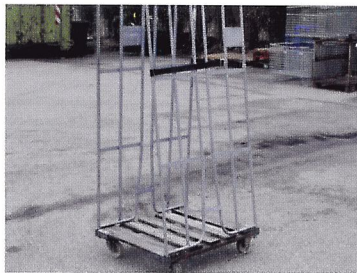
Afb. 1.56 Een rolcontainer is een voorbeeld van een statiegeldverpakking. Als je die terugstuurt, krijg je geld terug.